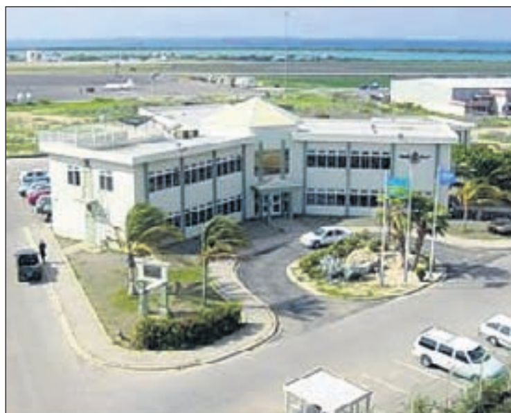
Edificio di departamento di Aviacion Civil.

Segun informacion no oficial cu na Aruba actualmente tin expertonan riba e tereno aki cu tabata traha un tempo cu FAA y a ofrece Departamento di Aviacion pa yuda nan pero a wordo nenga. Esaki